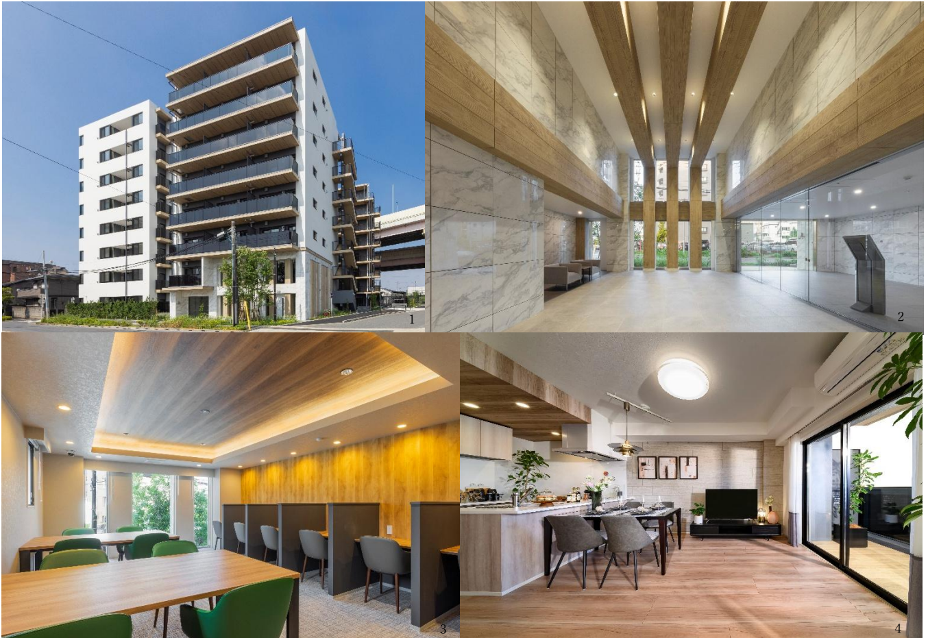
1.外観 2.エントランスホール 3.ワークラウンジ 4.リビング・ダイニング・キッチン (Gタイプ)